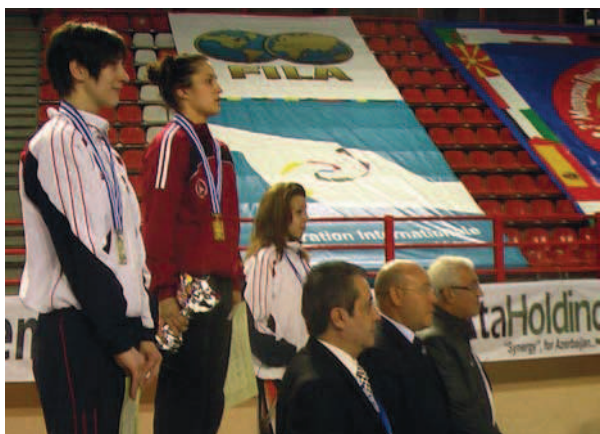
Les grandes équipes du championnat de la méditerranée: Turquie, Egypte, Grèce et Serbie

LA MÉDITERRANÉE C'EST LA LUTTE THE MEDITERRANEAN IS WRESTLING